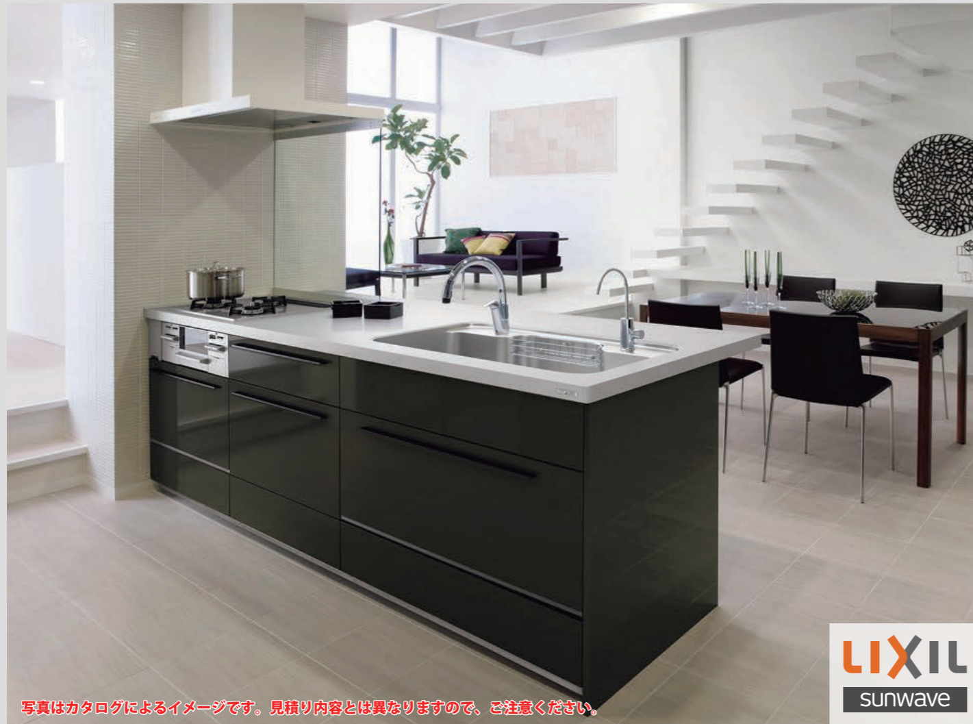
写真はカタログによるイメージです。見積り内容とは異なりますので、ご注意ください。