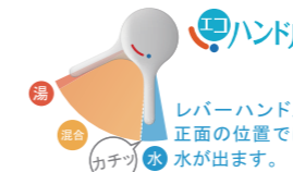
お湯が混合する位置はクリックでお知らせします。