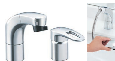
シングルレバーシャワー水栓