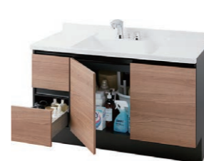
※写真はイメージです。 引出タイプ (ソフトサイレンスなし・棚板なし)