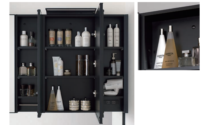
下部照明 (H2,200mmのみ) 手元灯演出照明として